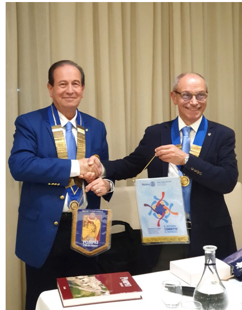
Lo scambio dei labaretti

presenti il Bollettino n.2 set. - ott. 2019 del Club. Un brindisi augurale ha chiuso la ben riuscita serata rotariana.