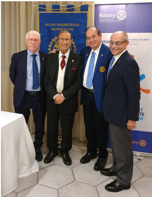
Il governatore con i decani del Club e il presidente

E' seguita la conviviale in onore degli illustri ospiti. Nel corso della cena il segretario ha distribuito ai