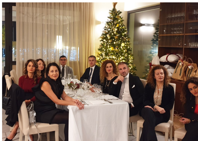
Soci e ospiti

tano: cenni storici e indicazioni pratiche ", attirando l'attenzione dei presenti con la proiezione di belle immagini di pastori e scene presepiali stile Sette-