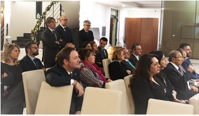
I soci nel corso della serata