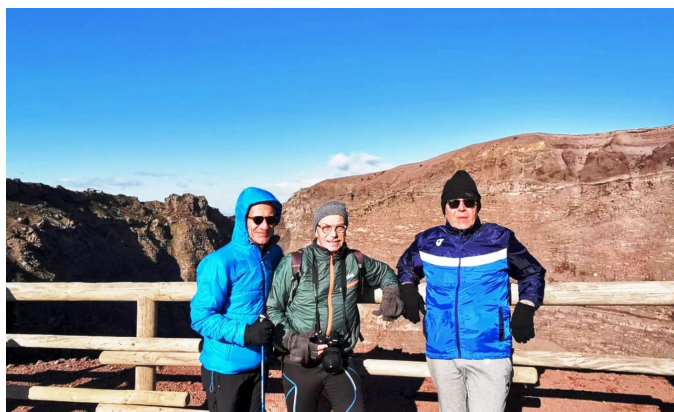
Sul cratere del Vesuvio

Tarallo (Rotaract). Il gruppo ha raggiunto il cratere seguendo il sentiero che parte dalla Valle delle Delizie di Ottaviano e attraversa la Valle dell'Inferno, tra il monte Somma e il Vesuvio. La giornata fredda