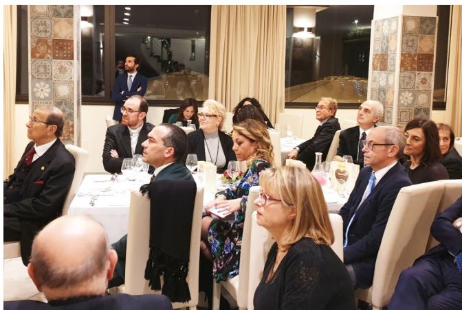
Soci e ospiti nel corso della serata

tano: cenni storici e indicazioni pratiche ", attirando l'attenzione dei presenti con la proiezione di belle immagini di pastori e scene presepiali stile Sette-