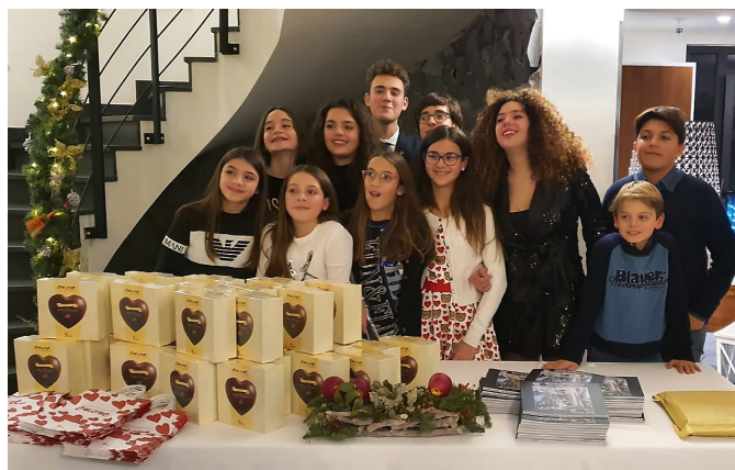
I giovani e giovanissimi del costituendo Interact