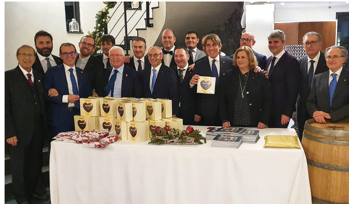
I soci del Club per la Fondazione Telethon