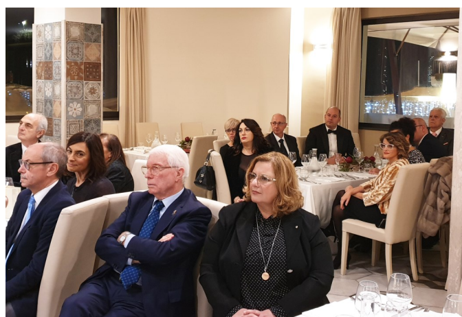
Soci e ospiti

cento. Un lungo applauso ha segnato la conclusione dell'intervento dell'arch. Pagano. Il presidente nel ringraziare il relatore gli ha donato dei libri su Pompei antica. E' seguita poi la conviviale, durante la quale il Club ha offerto alle Signore una statuina di