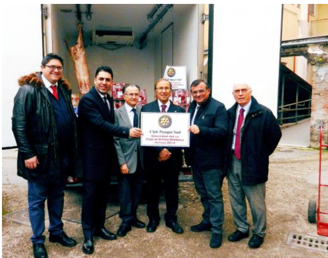
Il momento della consegna dei generi alimentari alla Casa di Riposo Borrelli