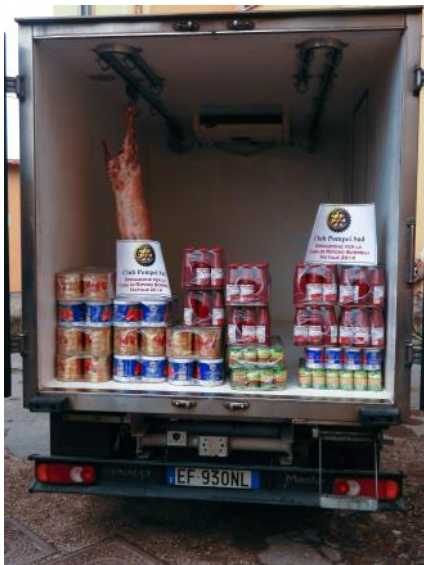
I generi alimentari offerti alla Casa di Riposo Borrelli