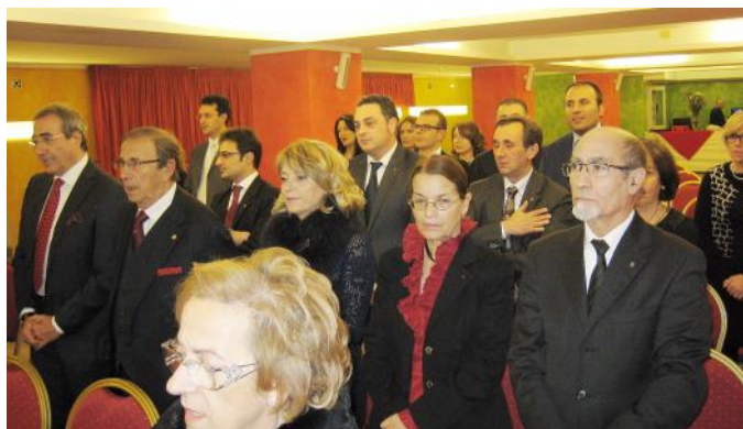
La sala gremita di soci ed ospiti