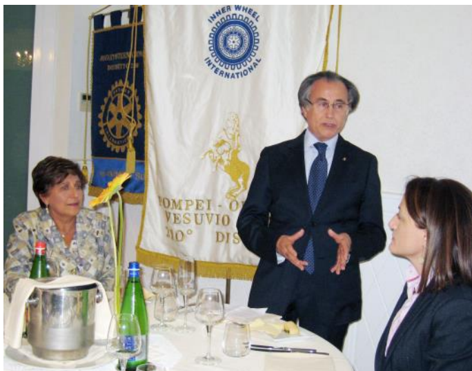
Il pres. Messalli porta il saluto del Club

Famiglia Cooperazione Onlus, cui fa capo tra l'altro il Centro Formazione di Koupéla, i quali con l'ausilio di un filmato hanno illustrato le attività dell'Associazione in Africa con particolare riguardo al Centro Jean Paul II.