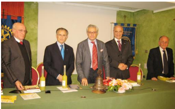
Il tavolo di presidenza dell'interclub