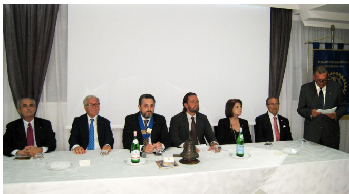
Il tavolo della presidenza