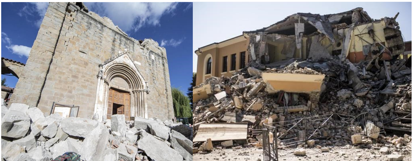
Una chiesa e una scuola distrutte dal sisma del 24 agosto 2016 in Italia Centrale